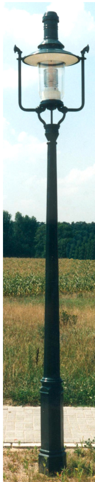
Sur candélabre THK-600/600-A

Ce luminaire peut avoir plusieurs arrangements tels que nos candélabres historiques en fer, ou nos supports muraux mais aussi d'autres arrangements.